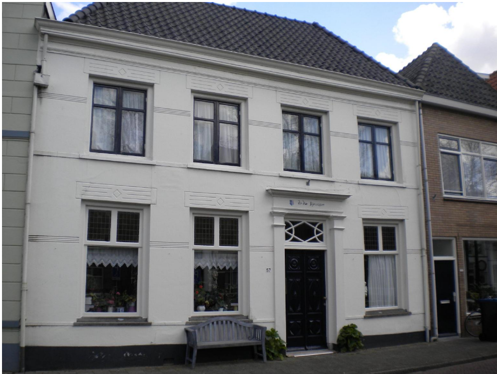
Het huis 'De drie Rijnvissen' aan de Burgwal 57 in Kampen (mei 2015)