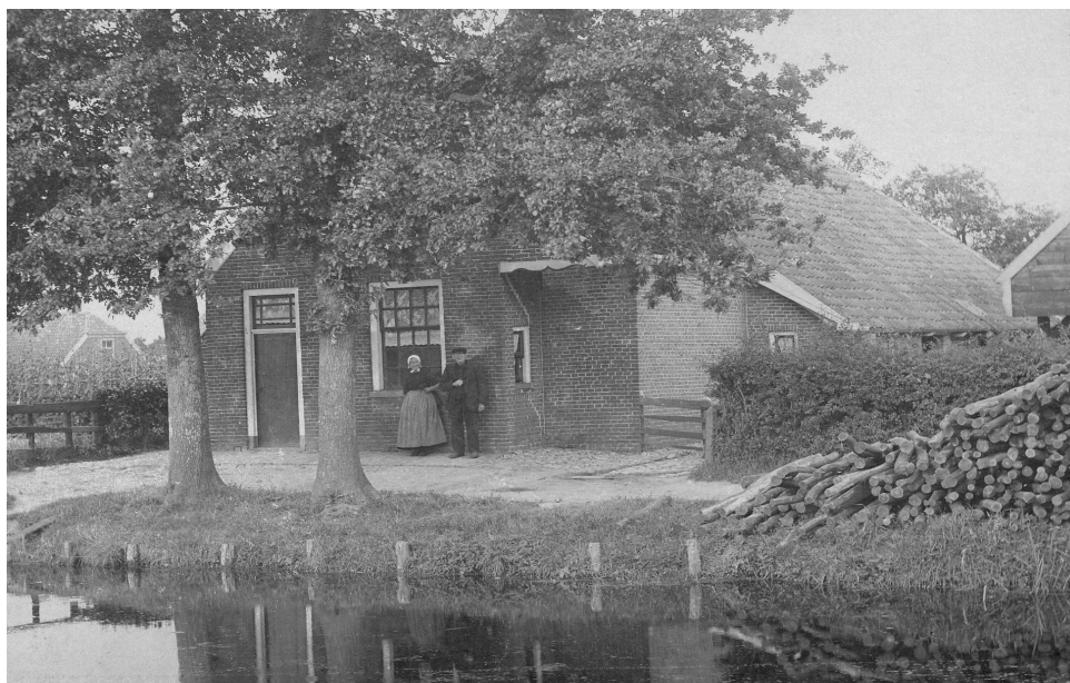
Roelof Stoffers Post en Geesje Stoffers omstreeks 1913 voor hun huis in de Wolfsbosch in Hoogeveen

Roelof Stoffers Post , geboren op 14-09-1831 in Hoogeveen, overleden op 16-01-1914 in Hoogeveen, trouwde op 01-05-1858 in Hoogeveen met Geesje Stoffers , geboren op 13-06-1830 in Dalen, overleden op 05-02-1922 in Hoogeveen.